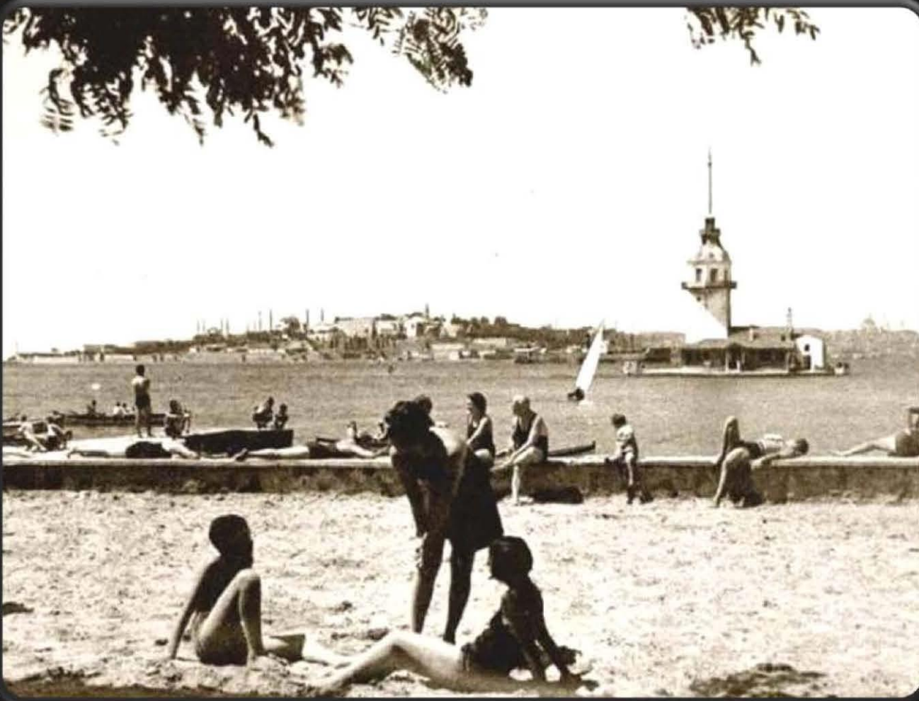
Salacak Plajı - İstanbul

La Turquie Kemaliste dergisinde çıkan bir fotoğraf