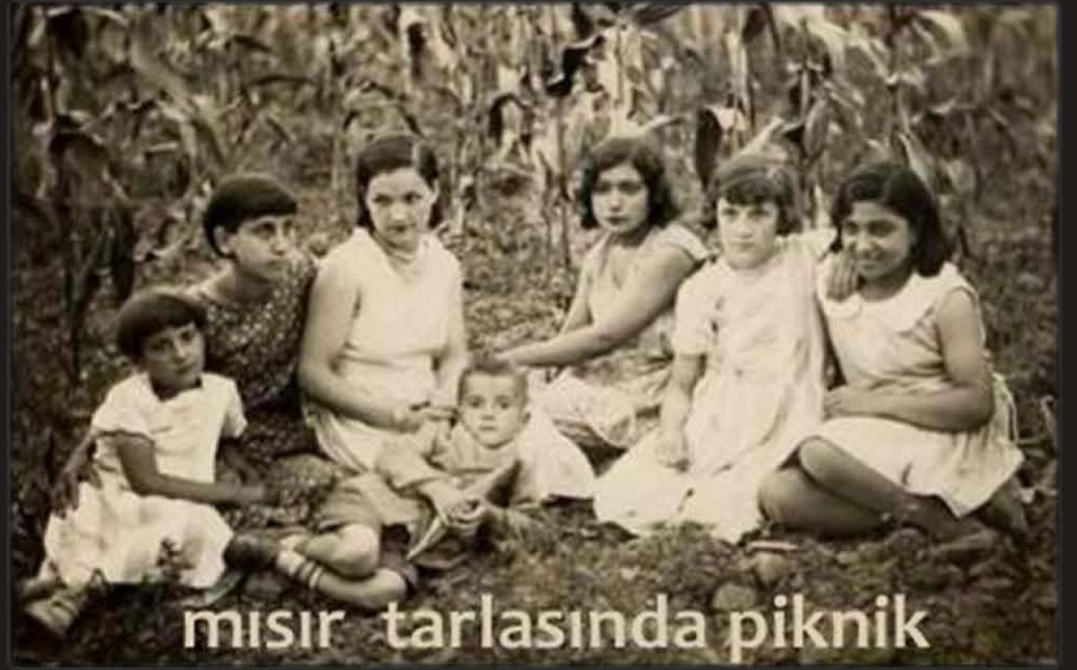
Urfalı hanımlar Suruç 1932